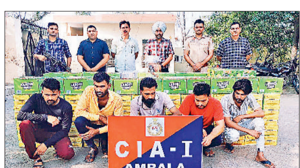
अंबाला। पकड़े गए आरोपी पुलिस हिरासत में।