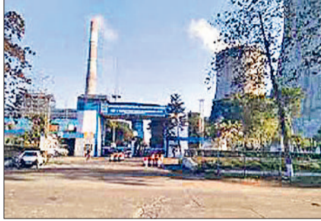
यमुनानगर के दीनबंधु छोट्टराम थर्मल पावर प्लांट का बाहरी दृश्य।

दीनबंधु छोट्टराम थर्मल पावर प्लांट यमुनानगर में जल्द ही 800 मेगावाट की अल्ट्रा सुपरक्रिटिकल यूनिट के निर्माण कार्य का जल्द शुभारंभ होने की उम्मीद बन गई है। यूनिट के निर्माण कार्य का शुभारंभ किए जाने के लिए केंद्रीय मिनिस्ट्री ऑफ इनवायरमेंट से क्लीयरेंस मिलने का इंतजार है। इससे पहले थर्मल प्लांट के दो यूनिटें, प्लांट में अब 800 मेगावाट की नई यूनिट का निर्माण होने से बड़ेगा बिजली उत्पादन