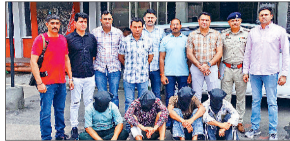
कुरुक्षेत्र। पकड़े गए आरोपी।

जिला पुलिस ने बड़ी वारदात को अंजाम देने की योजना बनाते चार आरोपियों को हथियारों के साथ गिरफ्तार किया है। अपराध अन्वेषण शाखा-1 की टीम ने सफलता हासिल की है।