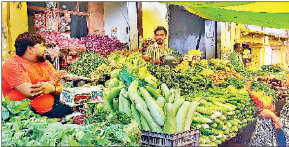
सब्जी मंडी में सब्जियां खरीदते ग्राहक।

बारिश ने लोगों को गर्मी से राहत तो दी लेकिन जेबों पर भार डाल दिया। हरी सब्जियों के दाम आसमान छूने लगे हैं। लाल टमाटर शतक लगाने की करीब पहुंच गया। बीते एक आम आदमी पखवारे से दाम पर पड़ रही बढ़ने से आम महंगाई की मार लोगों की थालियों से हरी सब्जियां गायब होने लगी हैं। साथ ही रसोई का बजट बिगड़ने लगा है। आम आदमी पर महंगाई की मार लगातार पड़ रही है। टमाटर के दाम बढ़ने के साथ अन्य सब्जियों के दाम भी बढ़ चुके हैं। सब्जियों के दाम सातवें आसमान पर पहुंच गए हैं। सब्जियों के बढ़ते दाम ने खाने का